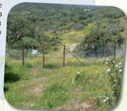
Cercado de protecção para coelho-bravo

Abutre-preto a alimentar-se num campo de alimentação