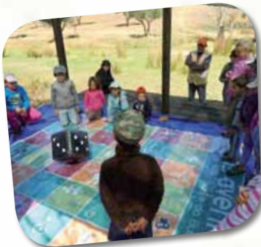
Actividades de educação ambiental