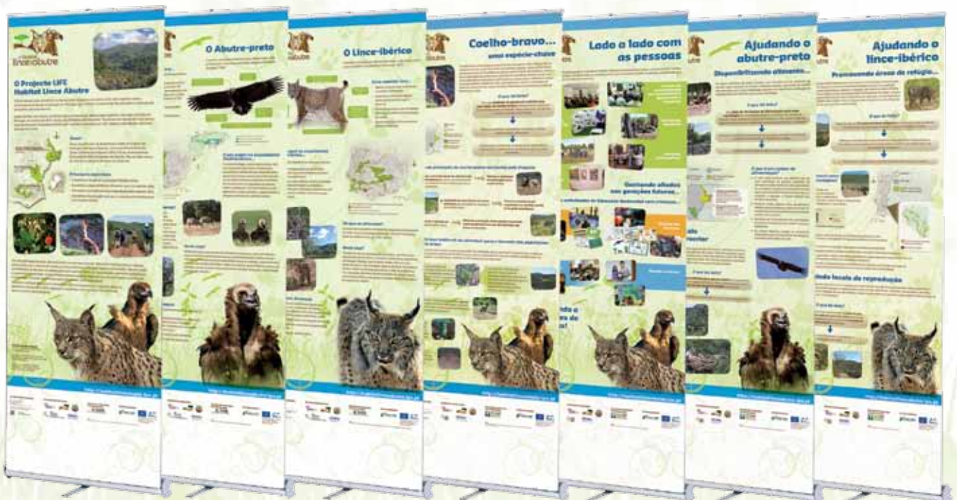
Exposição Itinerante produzida no âmbito do projecto