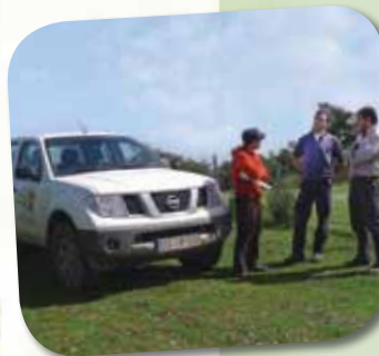
Negociação e assinatura de protocolos