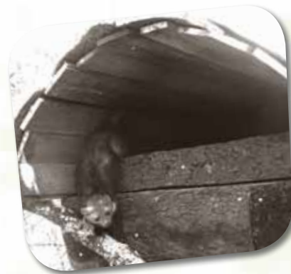
Fuinha a utilizar uma das tocas artificiais