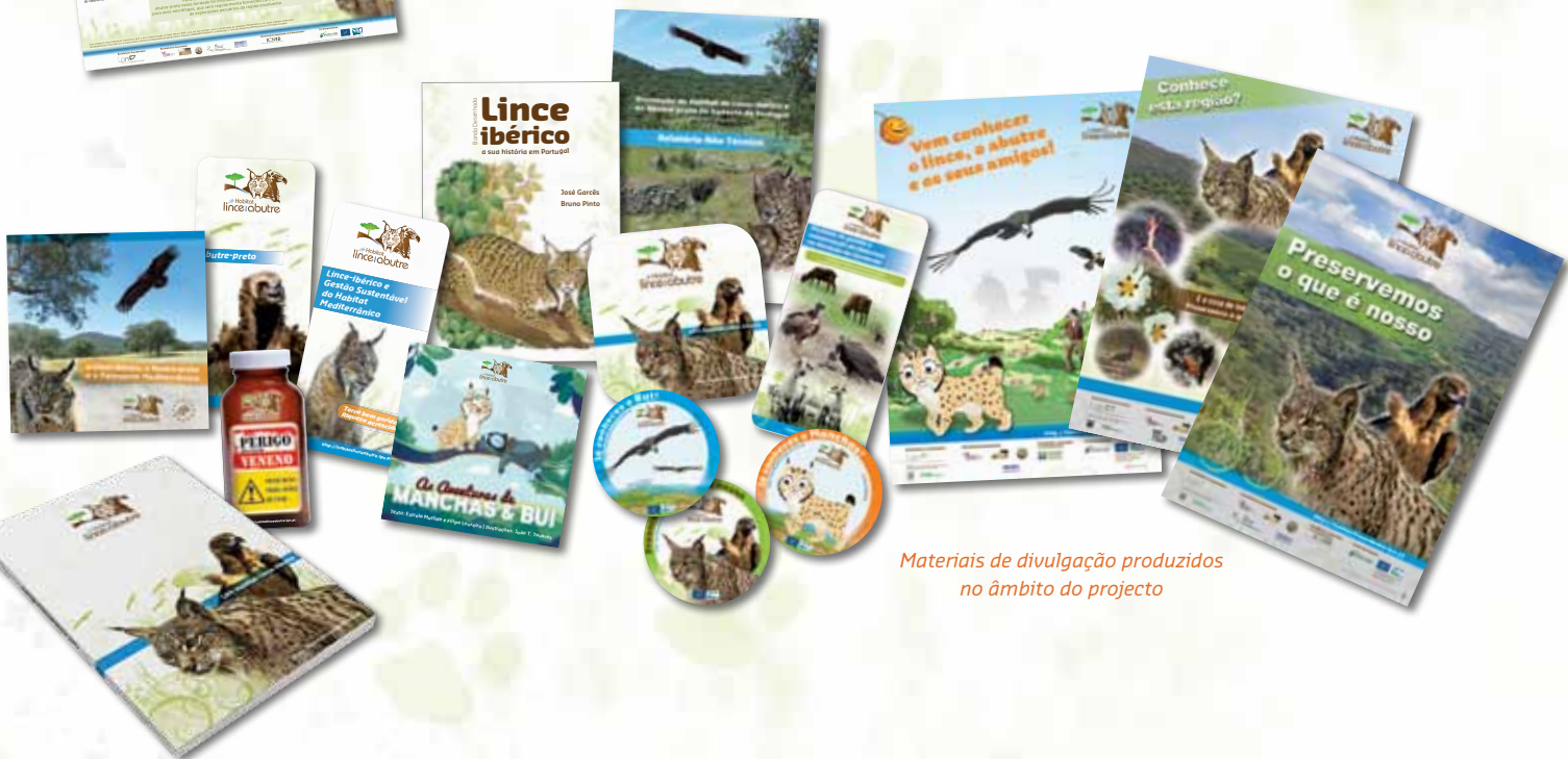
Materiais de divulgação produzidos no âmbito do projecto