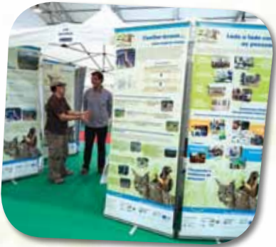
Participação em feiras

A falta de conhecimento relativamente à importância ecológica do linco ibérico e do abutre-preto contribuiu para que actualmente ainda morram indivíduos destas espécies por acção humana, tal como por envenenamento, atropelamento e/ou furtivismo. Para populações tão reduzidas como as destas duas espécies, o impacto da morte de um indivíduo que seja, é muito elevado.