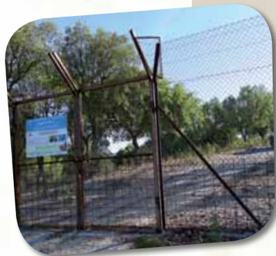
Entrada de campo de alimentação

Campos de alimentação são pequenas áreas vedadas, acessíveis apenas a aves e licenciadas pelas autoridades nacionais competentes. Aqui são regularmente depositadas carcaças de gado doméstico (rejeitando animais recentemente medicados) e/ou restos de ungulados silvestres (sem valor económico) provenientes da caça maior mediante um permanente acompanhamento veterinário para salvaguardar a saúde pública.