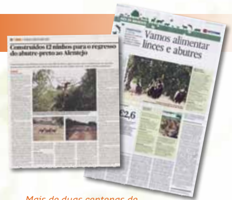
Mais de duas centenas de divulgações nos media

Outra forma de combater a falta de conhecimento é através da comunicação e disseminação do projecto. Para além do website do projecto, foram também produzidos diversos materiais de divulgação, uma exposição itinerante e, junto às medidas realizadas, colocaram-se painéis identificativos. Além disso, sempre que possível, divulgou-se o projecto junto da comunicação social através da realização de diversas entrevistas, reportagens e comunicados de imprensa.