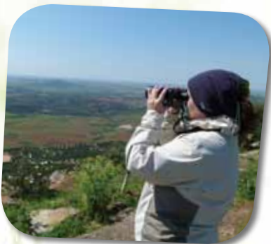
Participação de voluntários