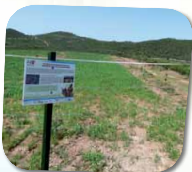
Cerca eléctrica para protecção de pastagens