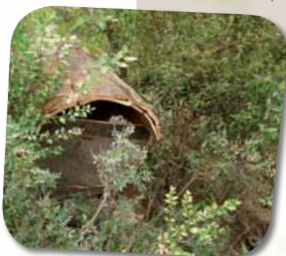
Toca artificial para lince-ibérico

Como locais de reprodução o lince-ibérico utiliza grandes árvores velhas e ocas, cavidades em rochas, matos densos e/ou amontoados de troncos (provenientes de gestão silvícola).