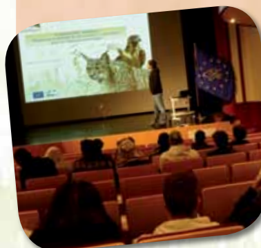
Participação em encontros científicos